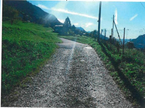
Situazione strada zona con pendenza 10%