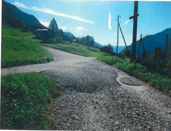
Accesso map 183