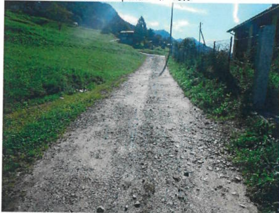
Situazione strada zona con pendenza < 3%